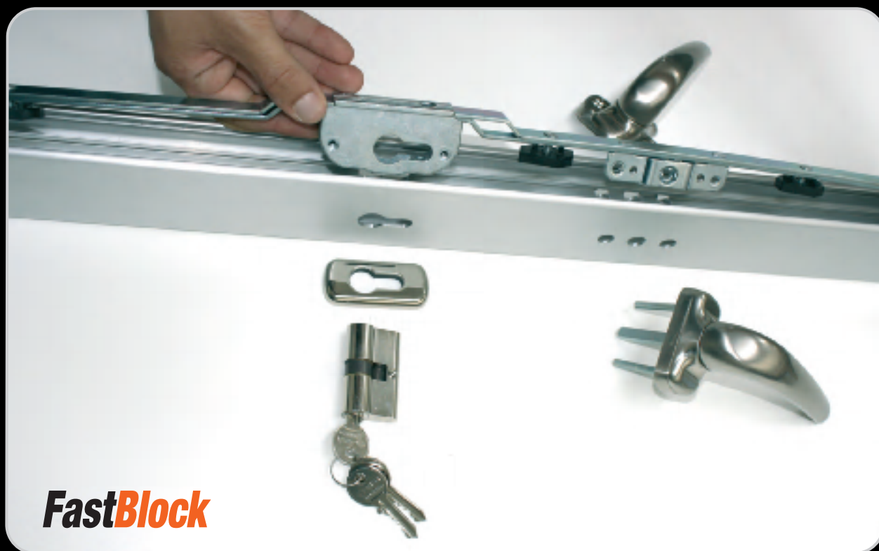
Predisposizione per cilindro a profilo europeo con possibilità di montaggio della doppia martellina.

Fast Block è l'evoluzione di Fast Lock, la chiusura multipunto che permette allo scorrevole di conservare la linea estetica dei sistemi a battente, grazie alla possibilità di montare la martellina e non più le tradizionali maniglie a vaschetta. Questa chiusura unisce alla praticità e alla velocità di montaggio del dispositivo di movimentazione integrato che si fissa per mezzo di camme o clip, maggiore sicurezza grazie alla predisposizione per serratura con cilindro a profilo europeo. Inoltre con Fast Block è possibile usufruire dell'opzione doppia martellina, ideale per porte d'ingresso e aperture con accesso diretto all'esterno. Sicurezza e resistenza sono garantite dalla qualità dei materiali utilizzati, infatti chiusura, riscontri, camme e viti sono in acciaio zincato e clip in nylon.