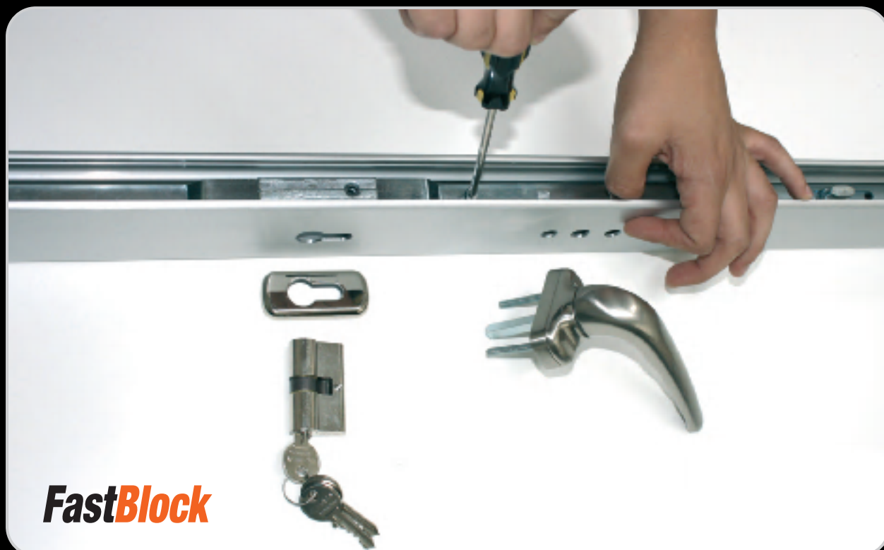
Praticità e velocità di montaggio del dispositivo di chiusura.