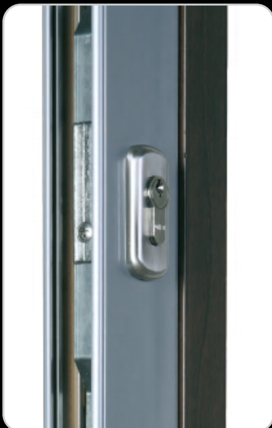
Art. 2129.2 - Copricilindro con parte esterna in zama